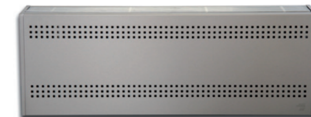
P 36 HR+